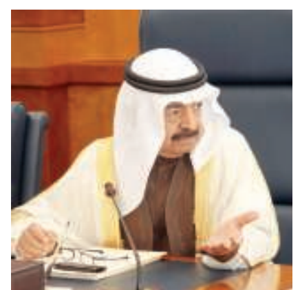
سمو رئيس الوزراء