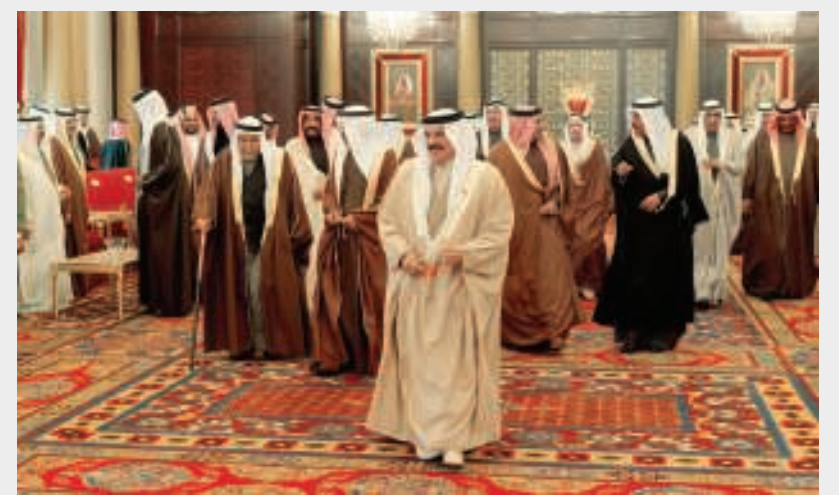
جلالة الملك المفدى خلال استقباله كبار أفراد العائلة المالكة