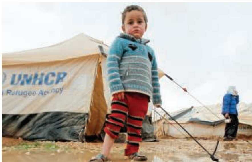
من يمسح بؤسك؟!

«الخيرية الأردنية»: «مجمع البحرين» ملاذ اللاجئين خلال العاصفة الثلجية